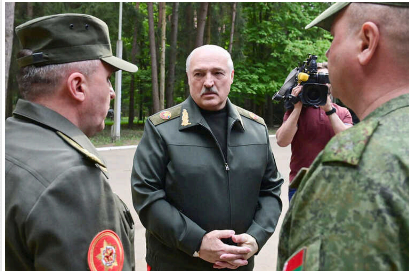
Білорусь призупиняє участь у договорі про скорочення озброєнь у Європі

Самопроголошений президент Білорусі Александр Лукашенко підписав закон про припинення дії договору про звичайні збройні сили в Європі (ДЗЗСЄ), підписаного 1990 року в Парижі.