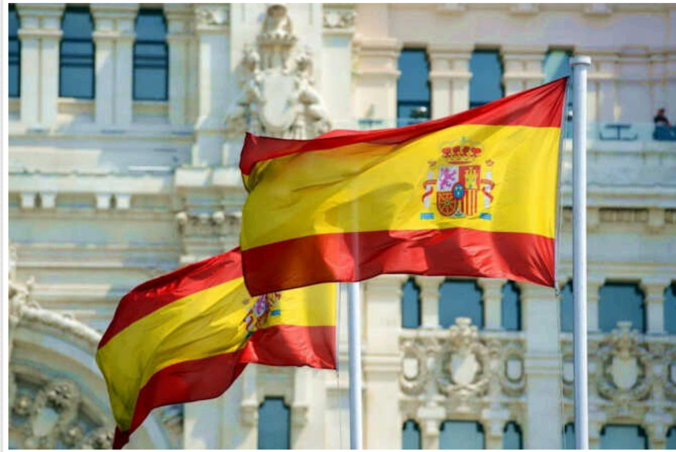
В уряді Іспанії ліві критикують прем'єра за військову допомогу Україні

Представники лівих партій в іспанському уряді прем'єр-міністра Педро Санчеса розкритикували його за обіцянку надати Україні мільярд євро військової допомоги у двосторонній безпековій угоді.