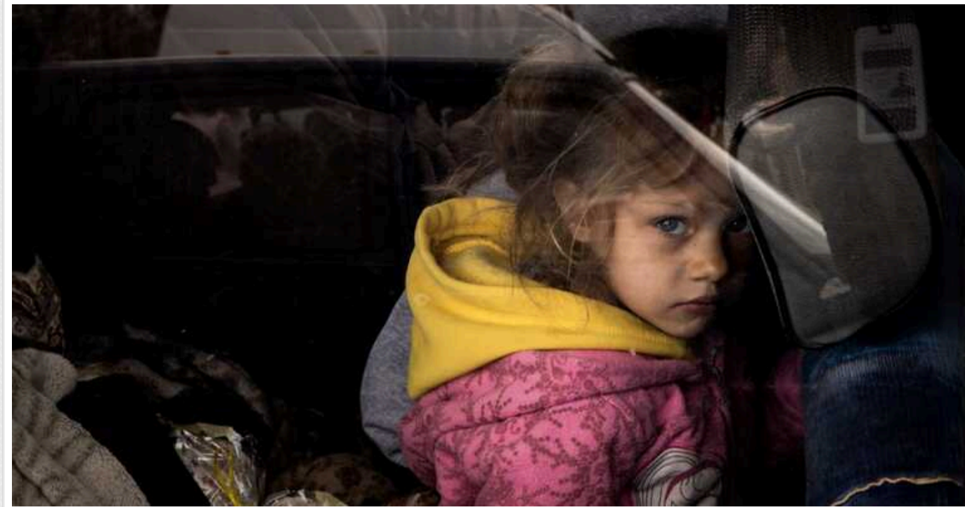
ISW: Окупанти хочуть вивезти з окупованих територій до РФ десятки тисяч українських дітей

Російська влада готується активізувати депортацію українських дітей до Росії впродовж літа, посилюючи ще один компонент російської кампанії геноциду в Україні.