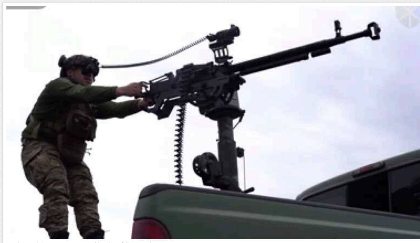
Росіяни цієї ночі атакували Україну 14 «шахедами»

Захисники неба України у ніч проти 29 травня збили майже всі ворожі ударні безпілотники типу "Шахед", які російські окупанти застосували для чергової повітряної атаки.