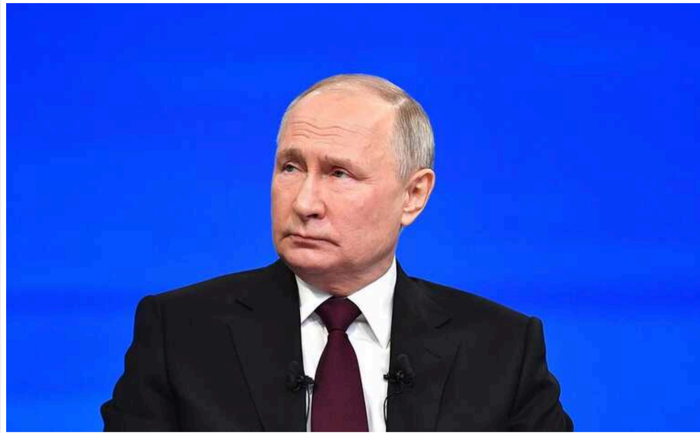
Путін лякає Захід глобальною війною за дозвіл Україні бити по Росії

Російський диктатор Володимир Путін попередив, що країни-члени НАТО в Європі "грають з вогнем", коли припускають імовірність надання дозволу Україні завдавати ударів західною зброєю по території РФ.