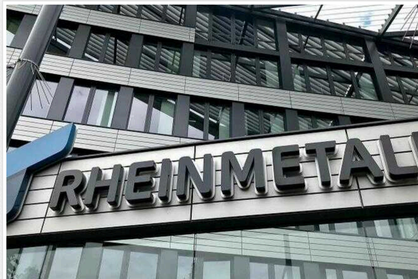
Концерн Rheinmetall отримав велике замовлення на боєприпаси для ППО

Одна із європейських держав замовила у німецького оборонного концерну Rheinmetall сотні тисяч боєприпасів для системи протиповітряної оборони.