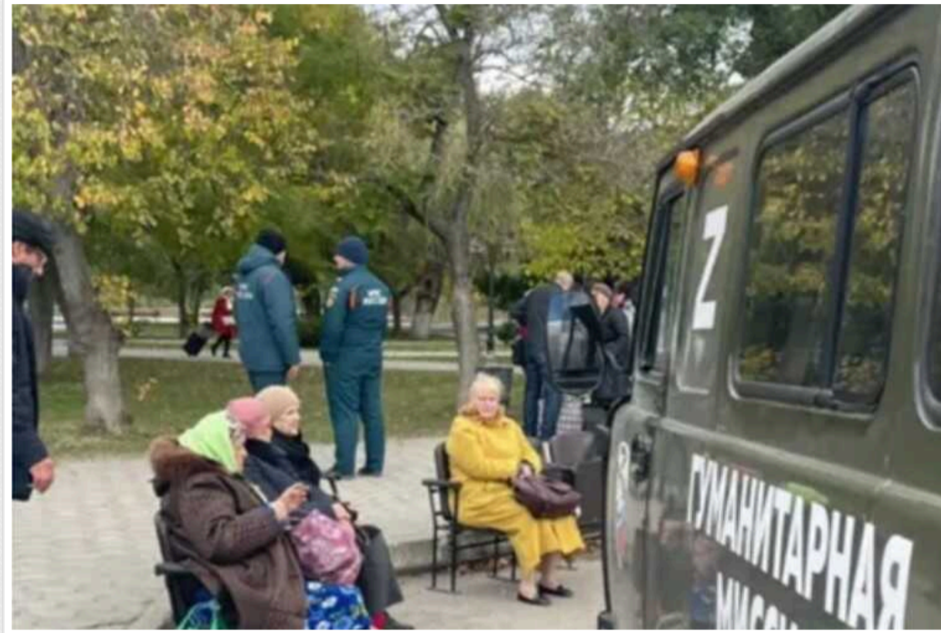
Ексдиректору Херсонського психоневрологічного інтернату оголосили підозру за допомогу окупантам

Колишній директор Херсонського психоневрологічного будинку-інтернату заочно підозрюється в пособництві державі-агресору й інших порушеннях законів та звичаїв війни.