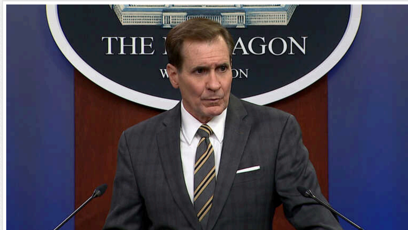
У США відреагували на удар Ізраїлю по наметовому табору у Рафасі

Ізраїльський удар по табору біженців у Рафасі, в результаті якого загинули десятки людей, був руйнівним, але не змусить президента Джо Байдена заморозити додаткові постачання зброї до країни.