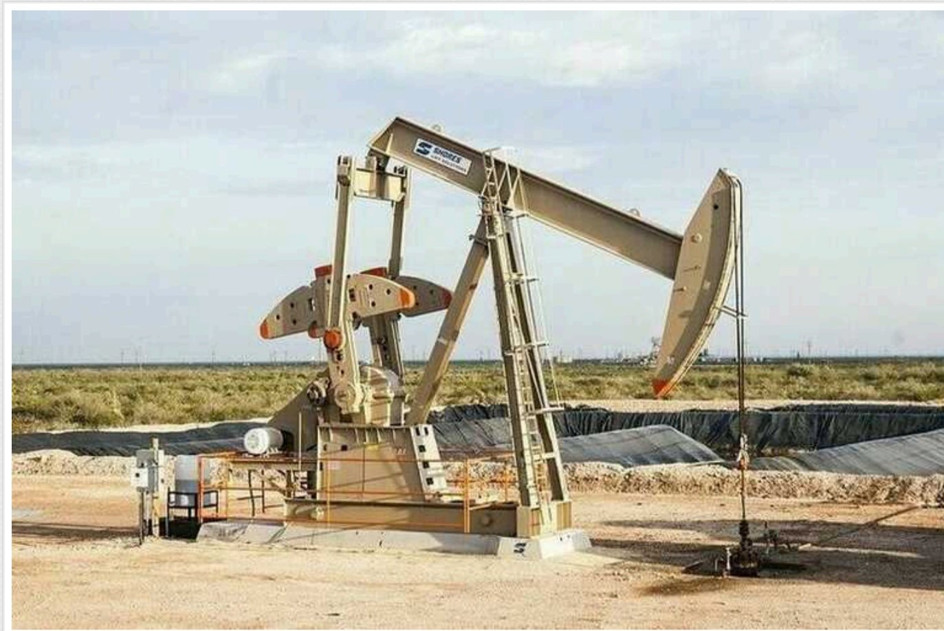
Індійська компанія Reliance Industries погодилася купувати у Росії нафту за рублі, - Reuters

Reuters пише, що найбільша нафтопереробна компанія Індії погодилася купувати у Росії нафту за рублі.