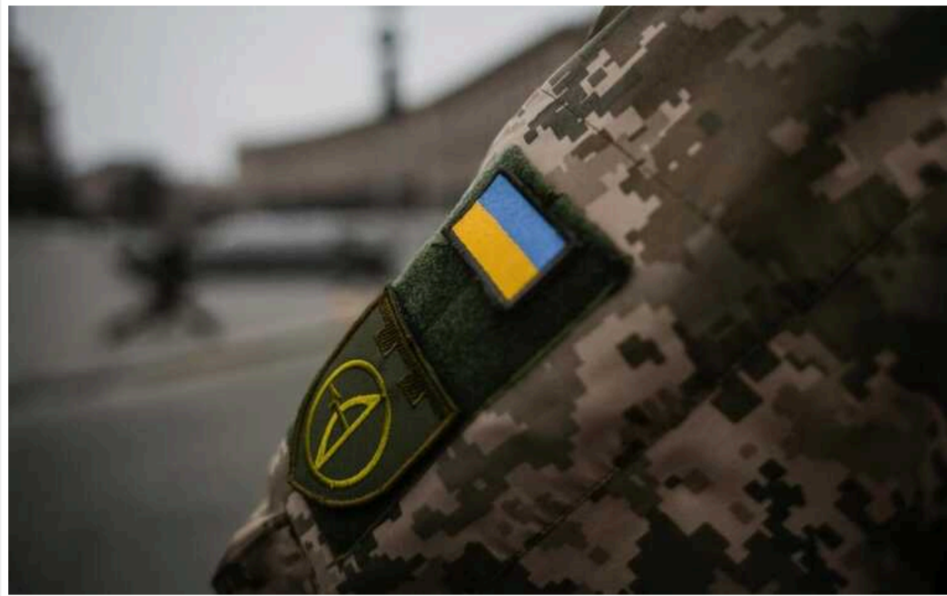
Повістки юнакам від 17 років не пов'язані з мобілізацією: роз'яснення Сухопутних військ ЗСУ

У ЗСУ заявляють, що 17-річні парубки отримують повістки для прибуття до ТЦК та постановки на військовий облік.