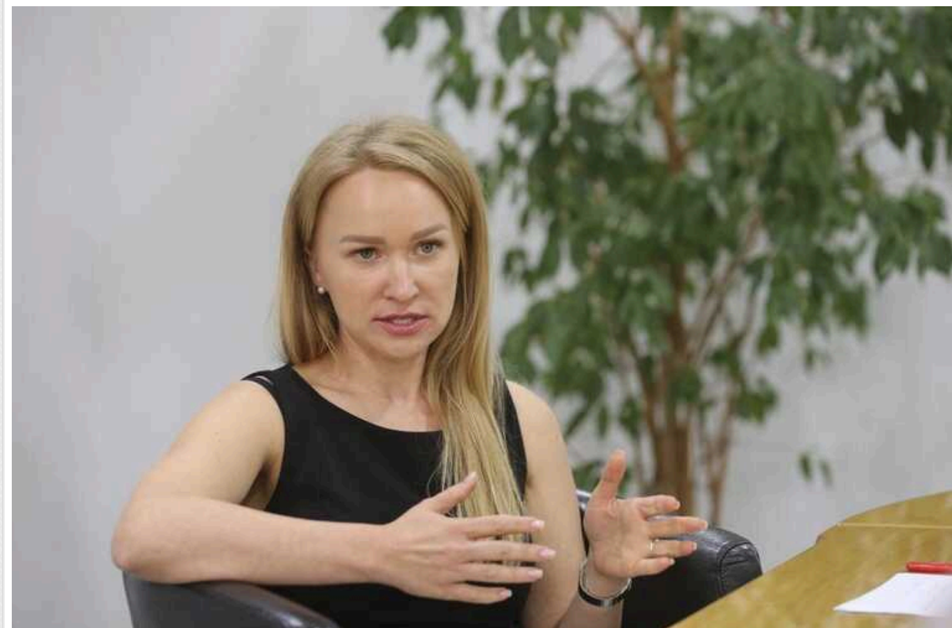
Керівницю ФГВФО Рекрут треба звільнити, щоб вона не плямувала репутацію влади, – експерт

Читати на руском Read in English Додати як бажане джерело в Google