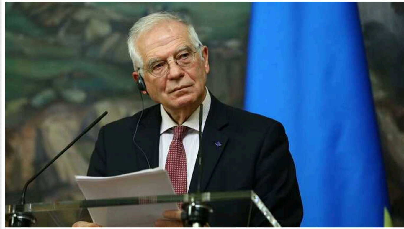
У Євросоюзі немає консенсусу щодо дозволу Україні бити по території РФ західною зброєю, - Боррель

Глава євродипломатії Жозеп Боррель заявив, що в ЄС немає консенсусу щодо надання Україні дозволу бити західною зброєю територією РФ та відправлення інструкторів для навчання українських військових в Україні.