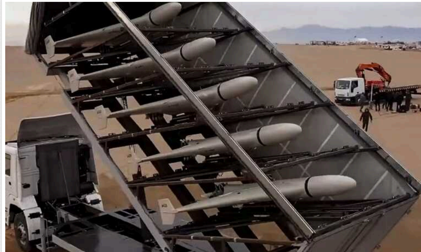
У РФ найняли понад тисячу жінок із Африки для збирання іранських дронів в Алабузі

Війна в Україні багато в чому перетворилася на війну дронів. Росія спочатку відставала у цій суттєвці, але потім почала закуповувати безпілотники Shahed в Ірані, а потім і виробляти їх на заводі в місті Єлабуга в Татарстані, в особливій економічній зоні (ОЕЗ) «Алабуга».