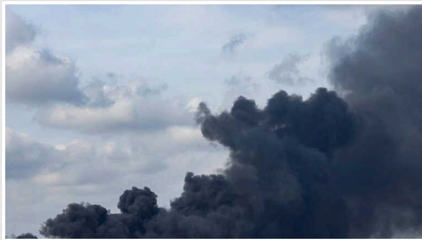
У Харкові пролунала серія вибухів

У Харкові 28 травня вдень пролунала серія вибухів. В області оголошено повітряну тривогу.