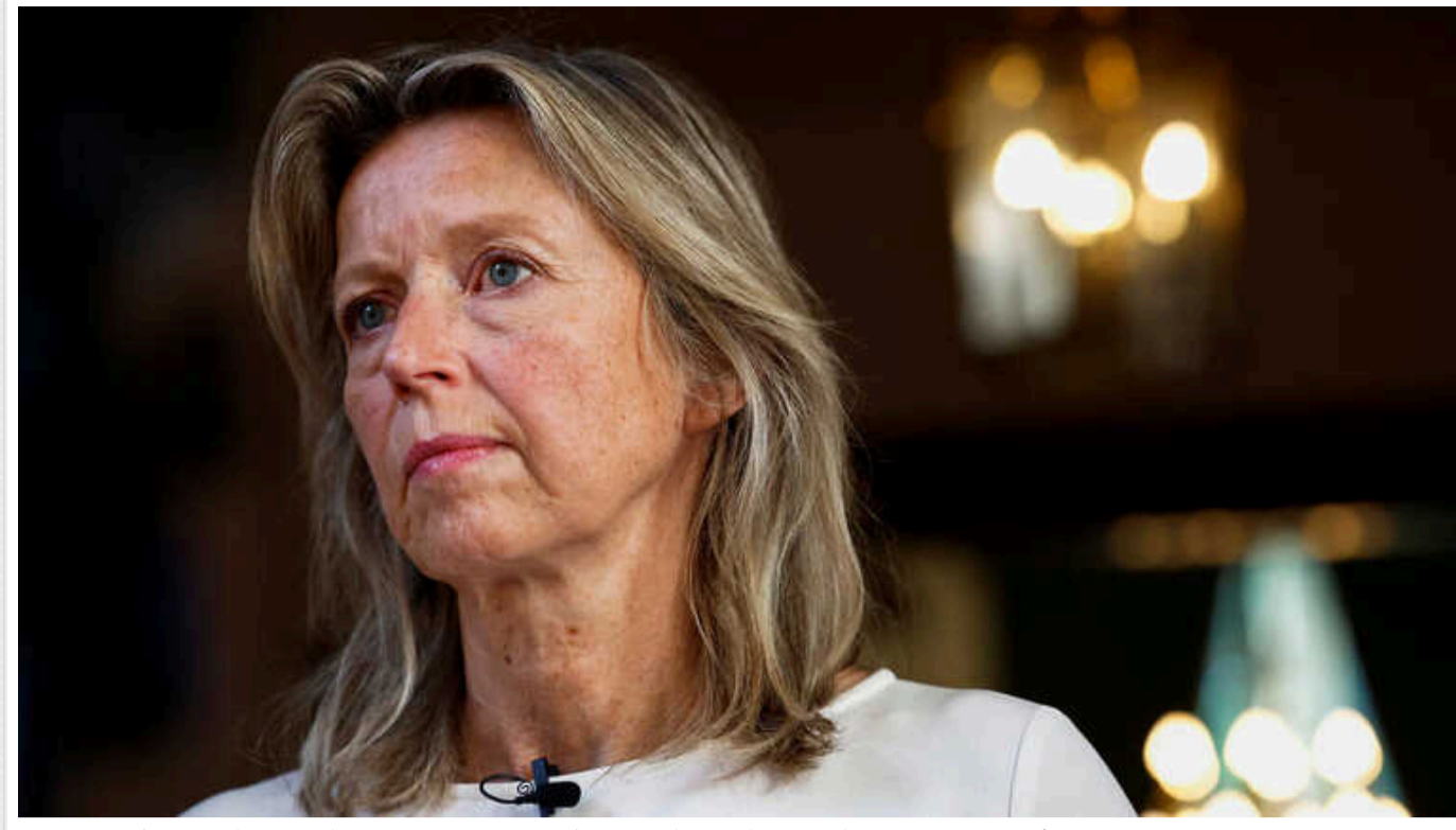
Це не має бути предметом дискусій, – глава Міноборони Нідерландів про удари України по РФ

Глава Міноборони Нідерландів Кейса Оллонгрена висловила про удари України по Росії. Вона наголосила на праві нашої країни завдавати ударів по цілям на території Росії.