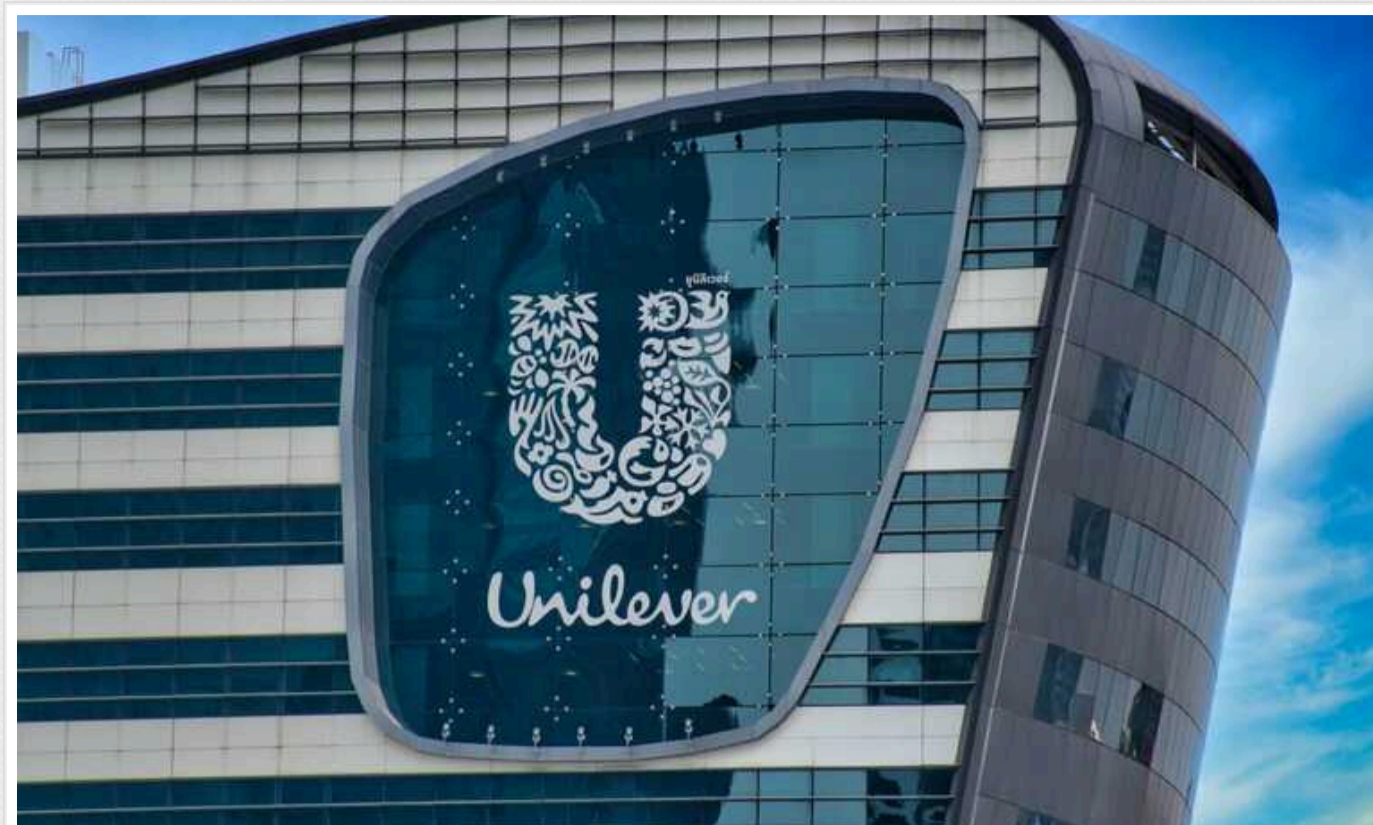
The Financial Times: Частина західних компаній передумали йти з РФ

За даними The Financial Times, одразу кілька європейських компаній змінили плани щодо ліквідації російського бізнесу, хоча заявляли про це раніше.