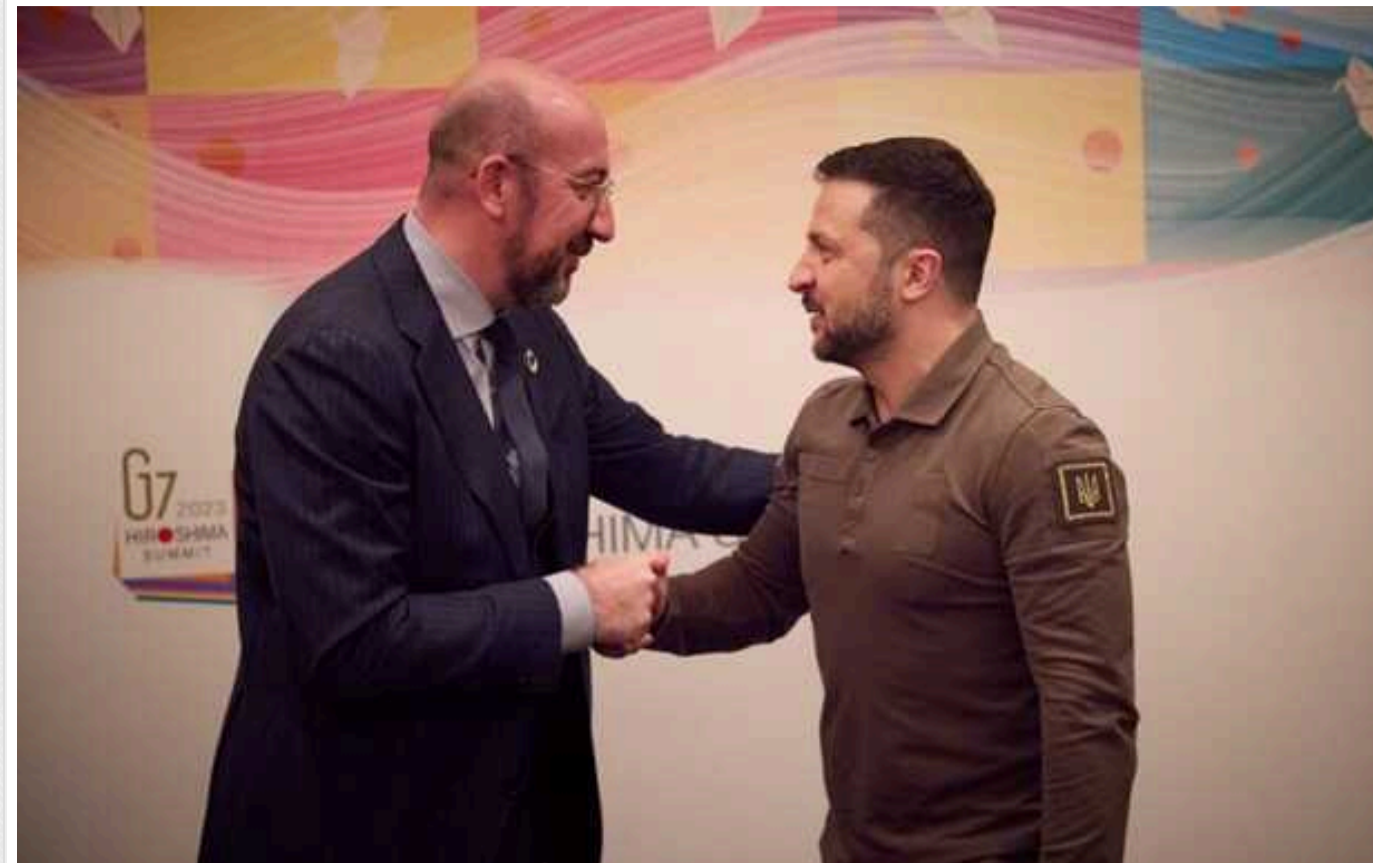
Зеленський та голова Євроради обговорили підготовку до Саміту миру у Швейцарії

Президент Європейської ради Шарль Мішель у вівторок провів телефонну розмову із президентом Володимиром Зеленським, під час якої вони обговорили останні події в Україні та підготовку до Глобального саміту миру.