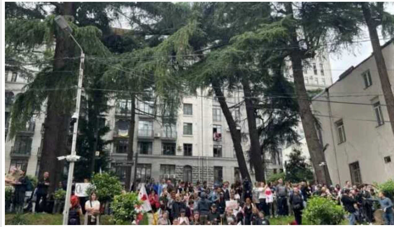
У Грузії біля парламенту проходить акція протесту проти закону «про іноагентів»

У Тбілісі біля парламенту Грузії зібралися учасники акції протесту проти грузинського аналога російського закону «про іноагентів».