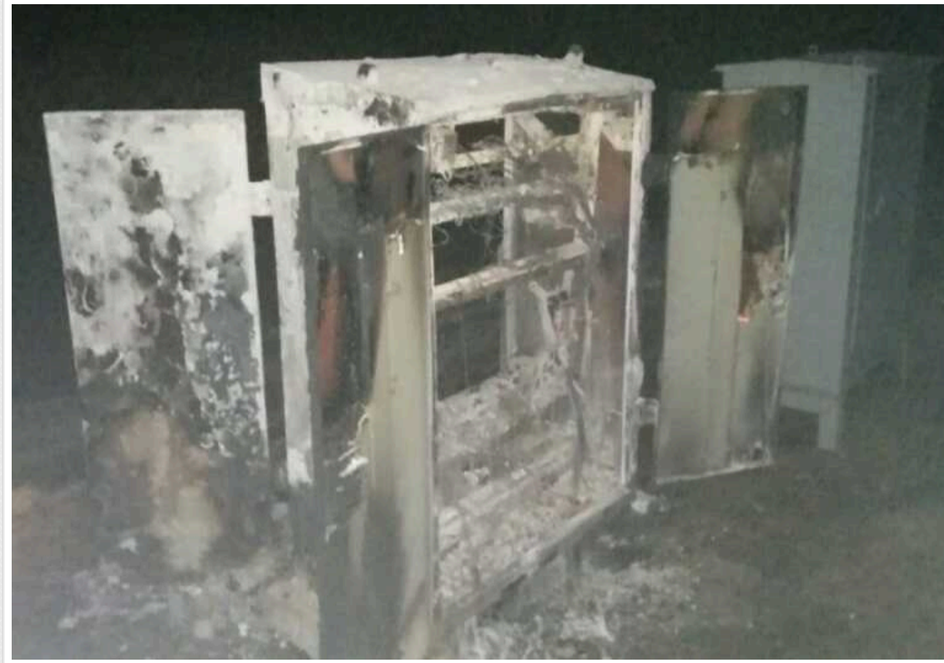
У Миколаївській області стався черговий випадок диверсії з підпалом релейної шафи на залізниці

Про це ЗМІ розповіли джерела у правоохоронних органах.