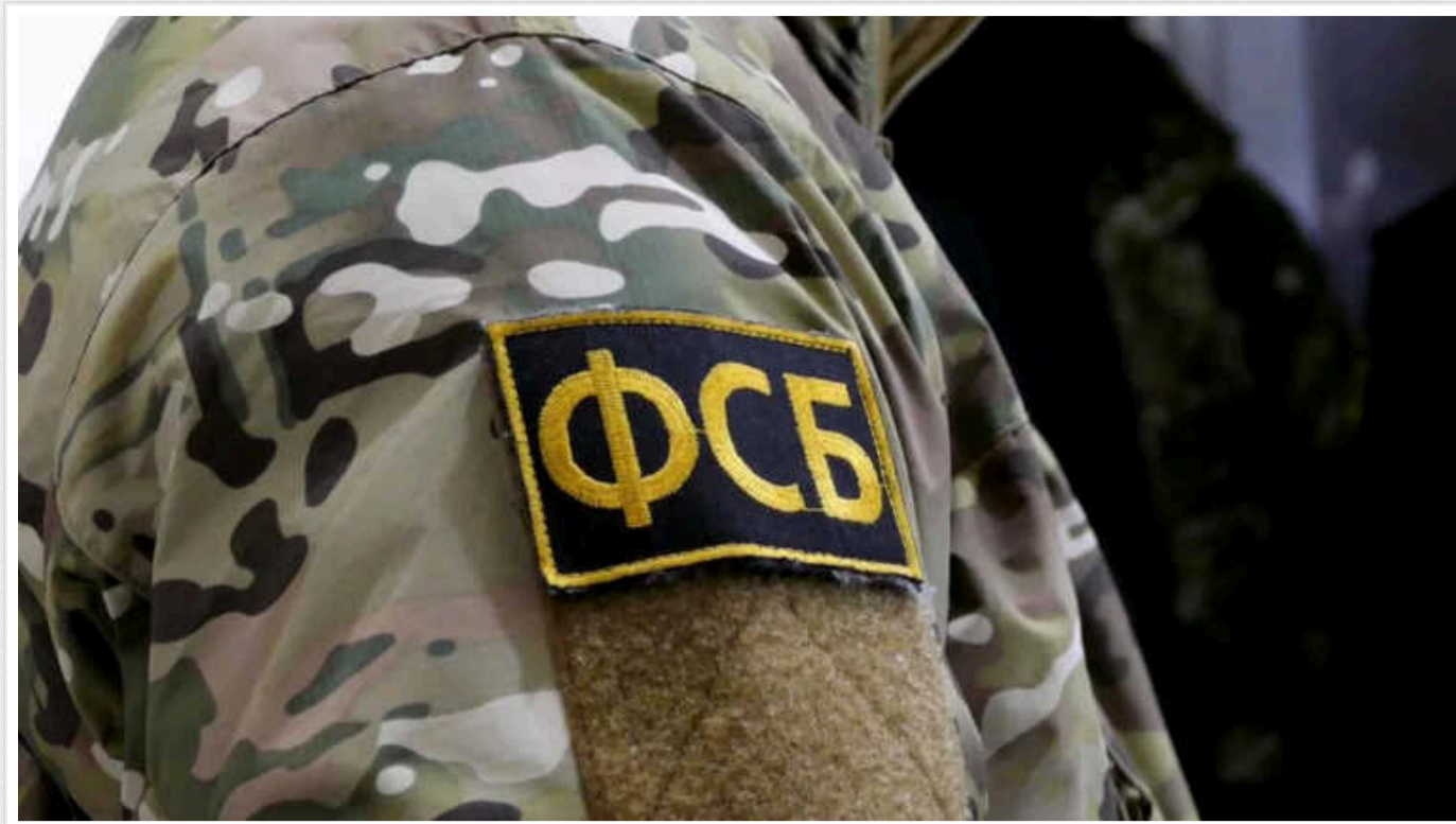
The Times: Як ФСБ планувала ліквідувати Буданова та взяти у заручники Зеленського, щоб той оголосив про капітуляцію