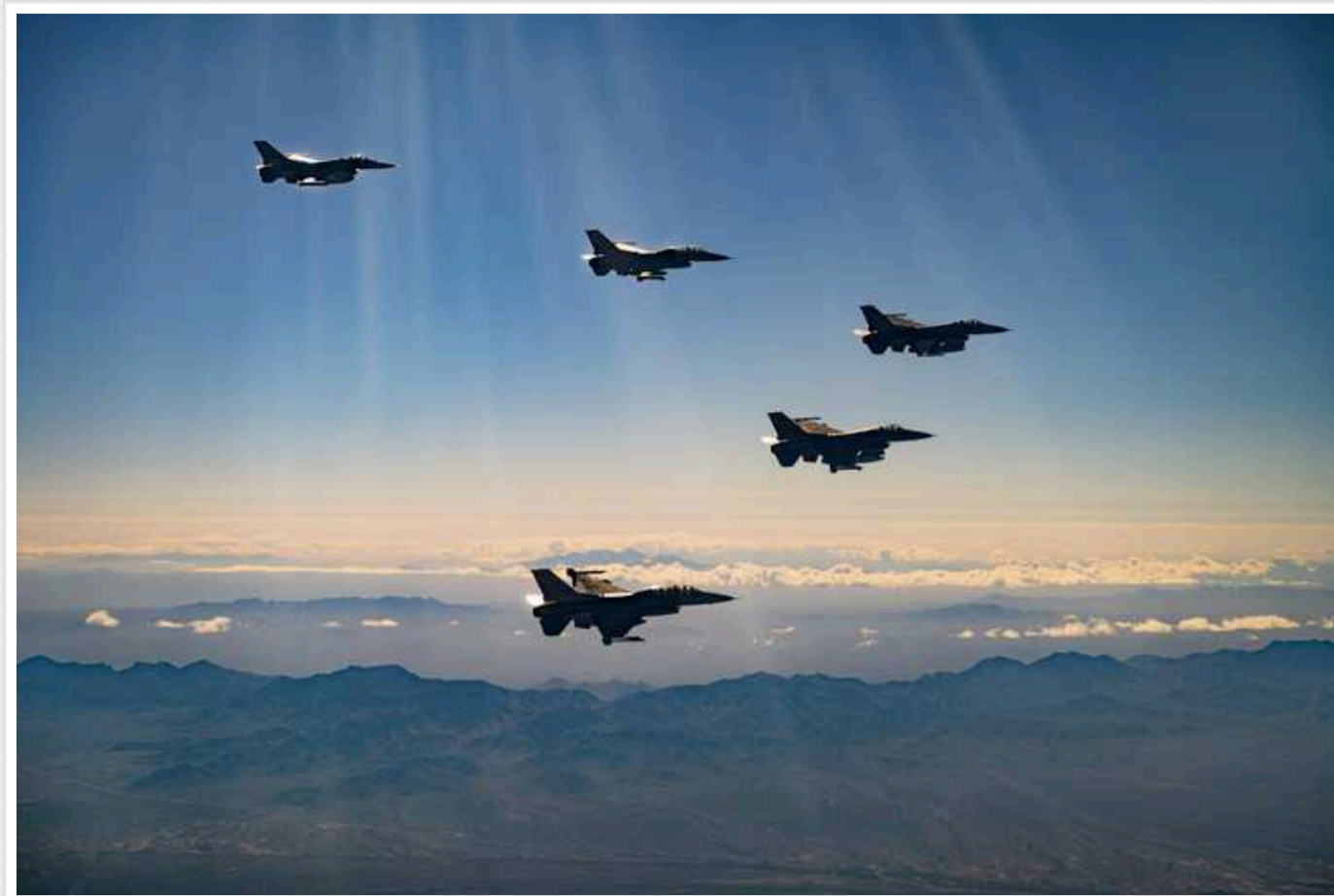
Бельгія до 2028 року передасть Україні 30 винищувачів F-16