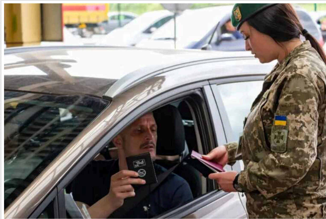
Деяким водіям в Україні не потрібний військовий квиток

У травні поточного року в Україні набув чинності новий закон про мобілізацію та військовий облік. Усі чоловіки віком від 18 до 60 років мають протягом двох місяців оновити свої військово-облікові дані у ТЦК. Крім того, військовозобов'язані чоловіки завжди повинні мати при собі військово-обліковий документ (військовий квиток).