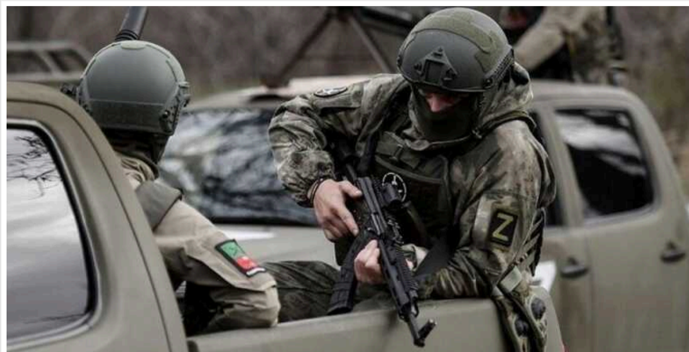
Минулої доби ЗС РФ знову просунулися в районі Уманського і на південь від Нетайлового на Покровському напрямку, – DeepState