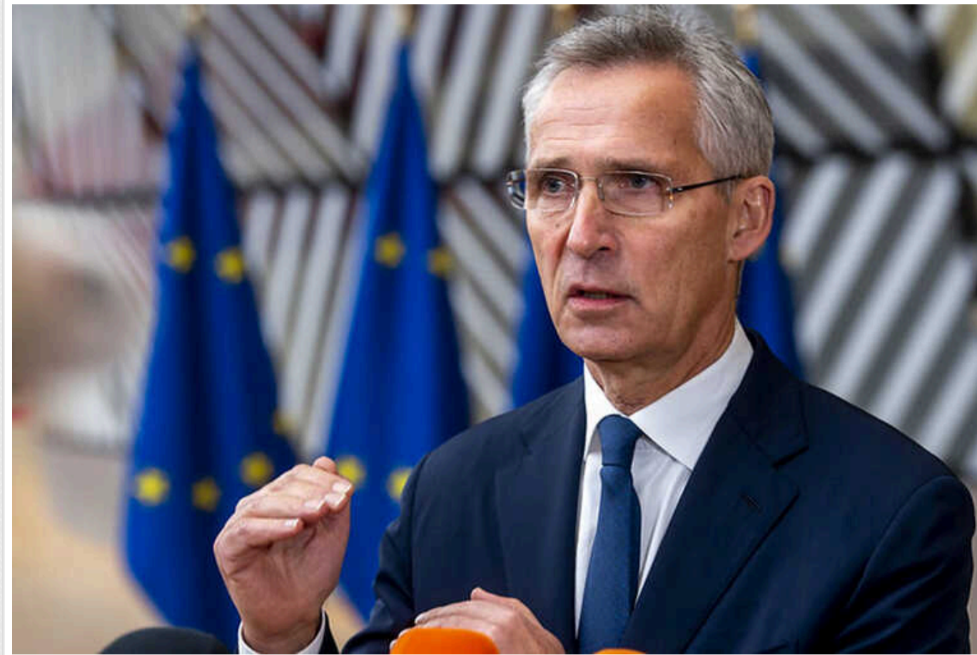
Столтенберг: Західна зброя, поставлена в Україну, належить українцям

Західна зброя, поставлена в нашу державу, вже належить українцям. Тому бити чи не бити по території країни-окупанта – вирішує саме Україна.