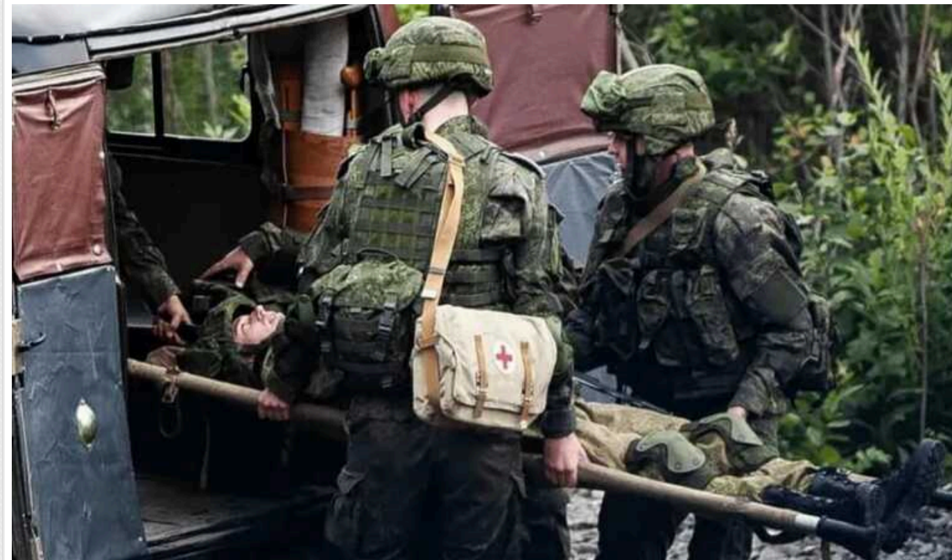
Лікарні на окупованих територіях України переповнені пораненими окупантами, – ЦНС

Окупаційні сили РФ зазнають великих втрат у війні проти України й про це свідчить ситуація в медзакладах на захоплених ними територіях. Лікарні там переповнені пораненими загарбниками, а персоналу не вистачає.