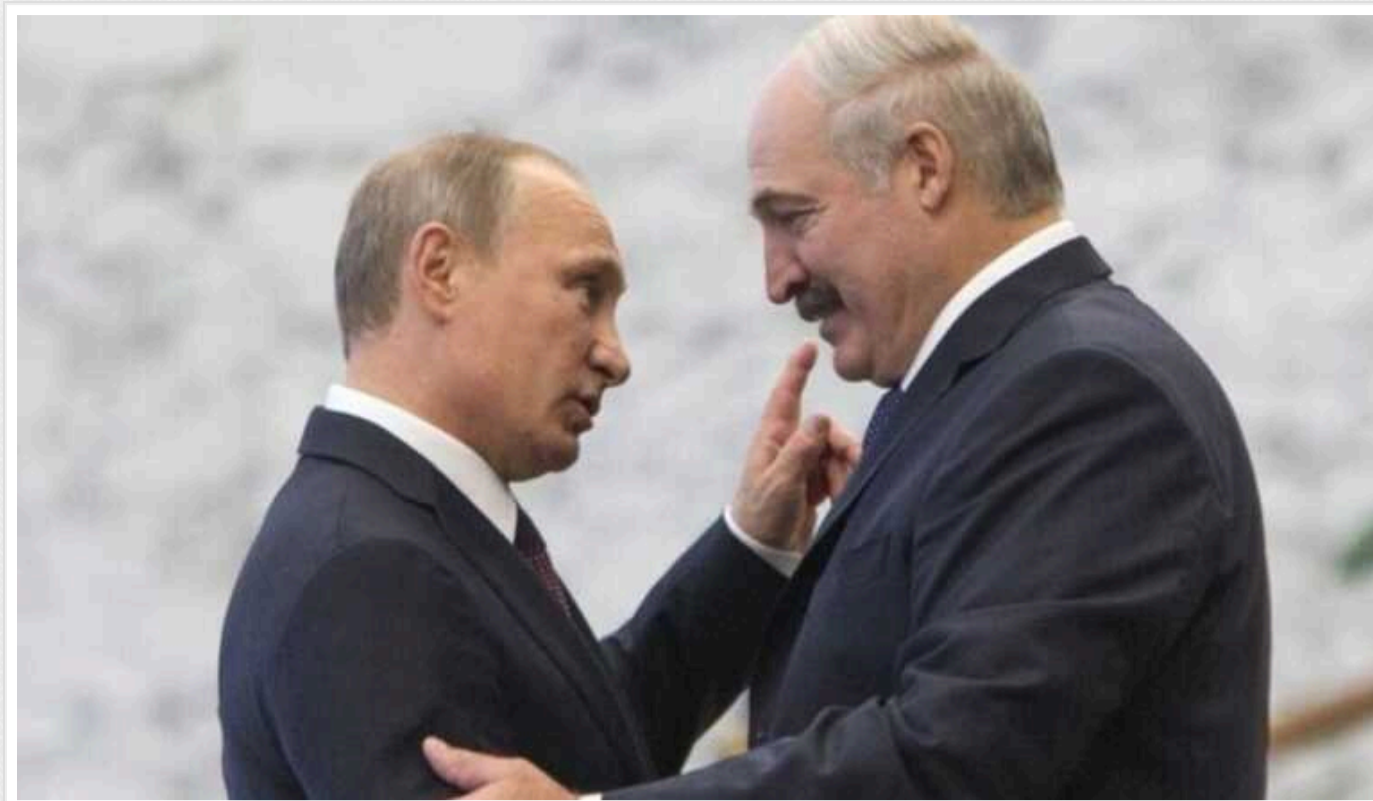
РФ планує запустити ІПСО про відкриття другого фронту з боку Білорусі, – ЦПД

Держава-агресор Росія, ймовірно, планує активізувати інформаційно-психологічну операцію про нібито відкриття в Україні другого фронту зі сторони Білорусі. Мета росіян – посягти паніку в українському суспільстві.