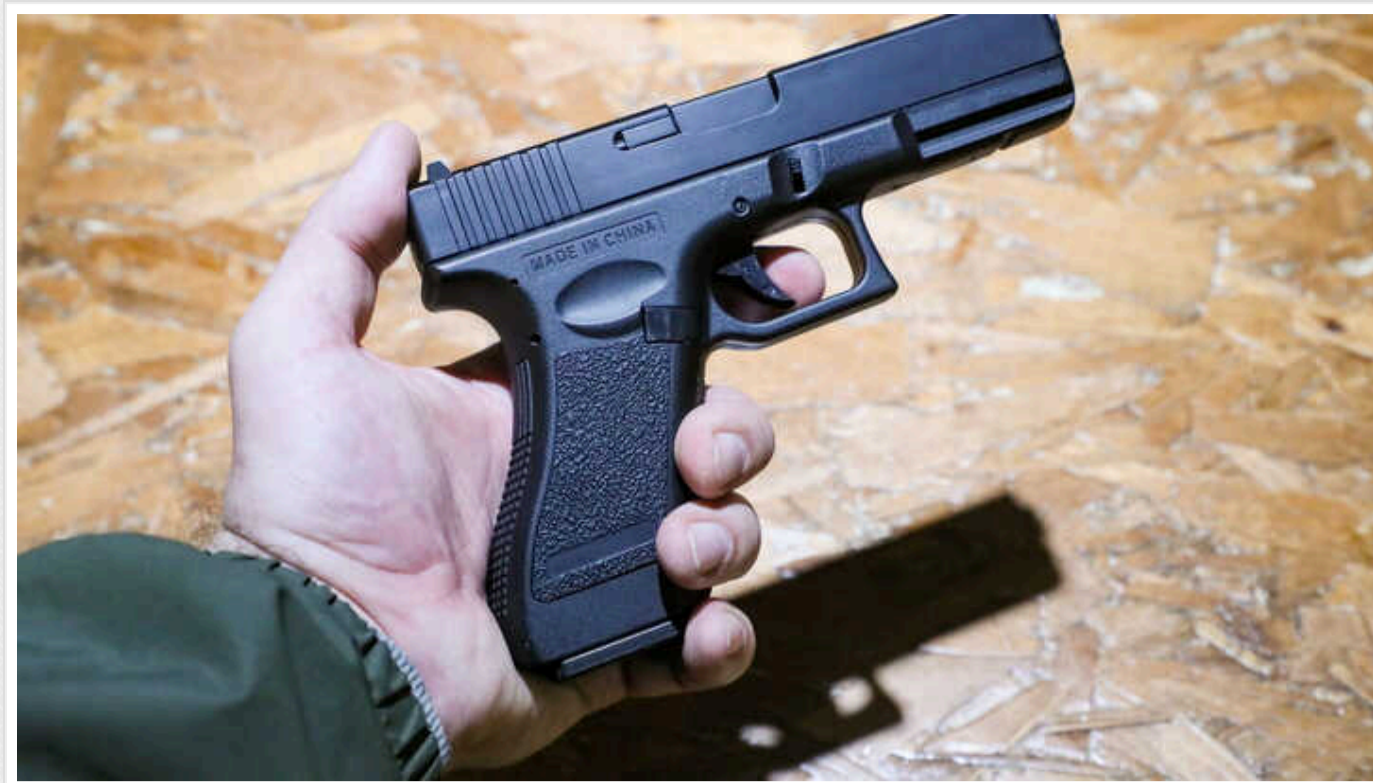
У Сербії почали судити родичів стрільця, який убив 9 людей

Вищий суд сербського міста Крагуєваць 27 травня почав суд над дядьком і братом 22-річного Уроша Блажича, який у травні 2023 року розстріляв дев'ятох люде у двох селах поблизу Белграда.