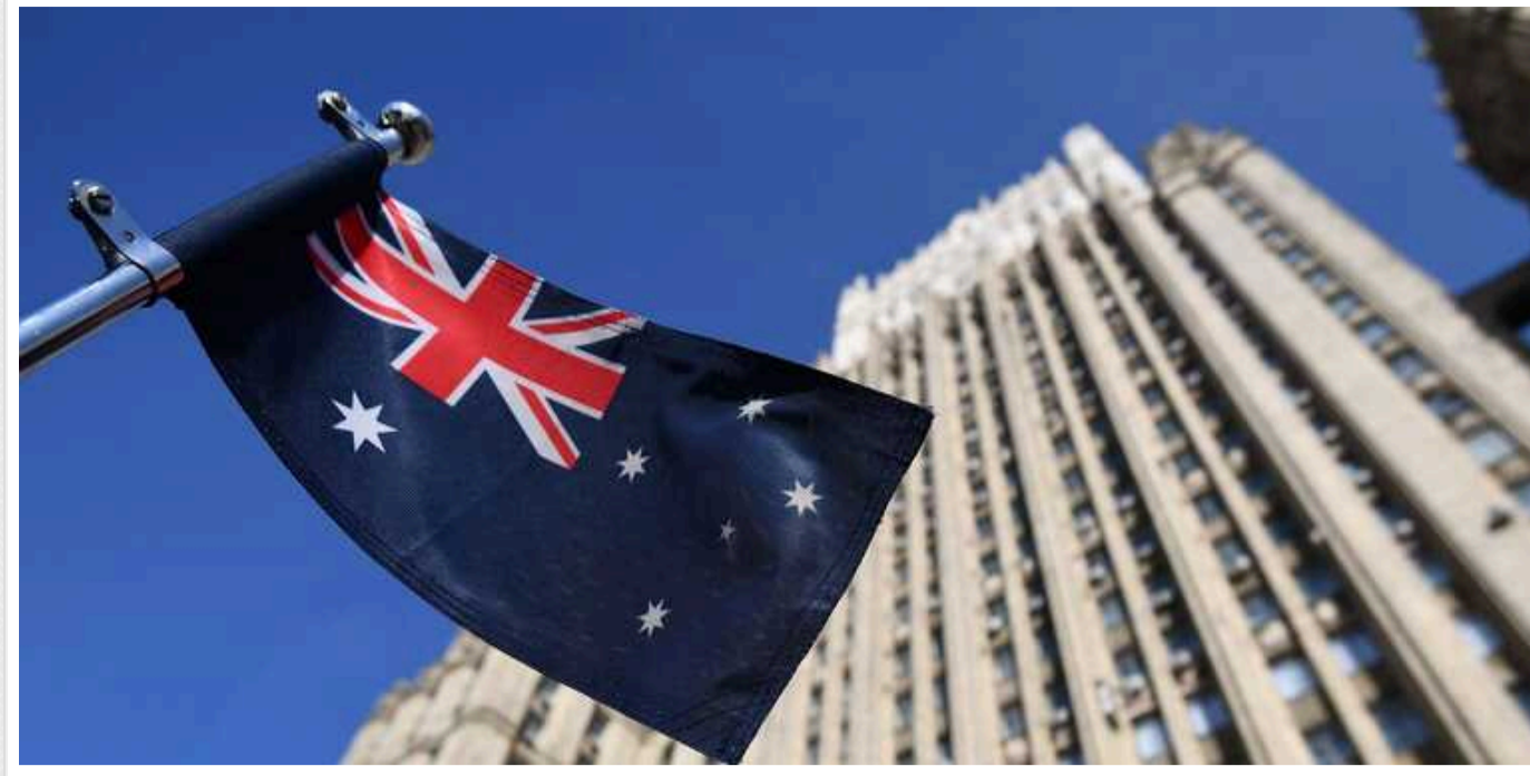
Австралія не має наміру використовувати активи РФ, заблоковані на її території, на користь України

Про це повідомив віце-прем'єр країни Річард Марлз.