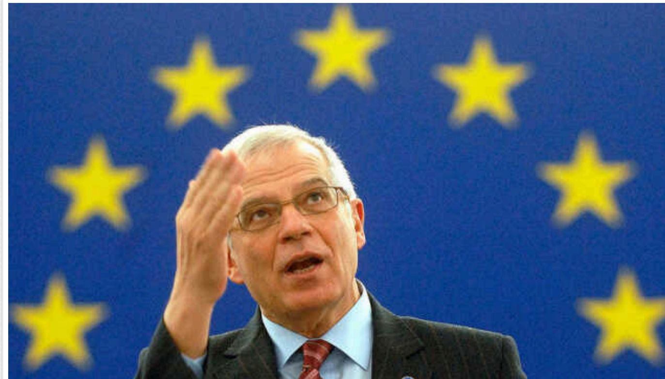
Боррель: Жодні внески Угорщини в Європейський фонд миру не йдуть на військову допомогу Україні

За домовленістю жодні внески Угорщини в Європейський фонд миру не спрямовуються на будь-яку військову допомогу для України, і водночас для ухвалення рішень щодо використання цього фонду і в інтересах захисту України ЄС має приймати рішення за принципом консенсусу.