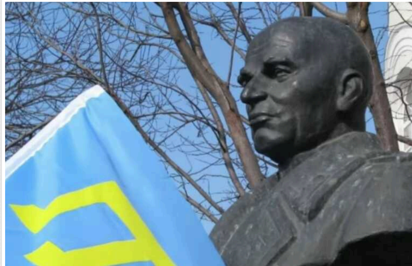
В окупованому Сімферополі знесли пам'ятник генералу, який захищав кримських татар

Окупанти знесли пам'ятник генералу-дисиденту Петру Григоренку, який підтримував кримських татар та виступав проти їх депортації радянською владою з Криму.