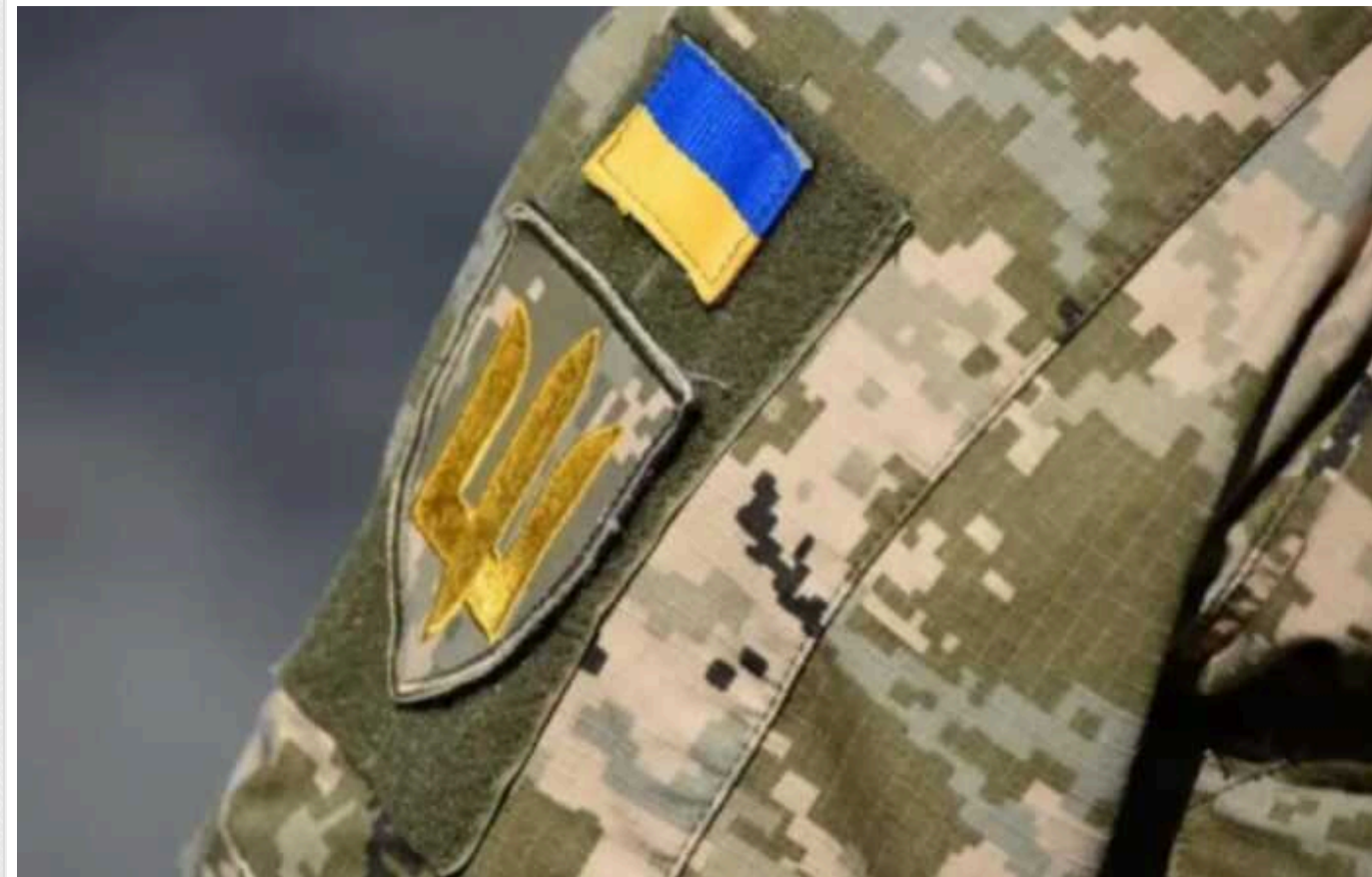
Чоловік, який порізав собі вени, розповів деталі скандалу з ТЦК на Київщині

Працівники ТЦК заштовхали мене в автівку і відвезли на безлюдну вулицу, дали ляпасів, погрожували.