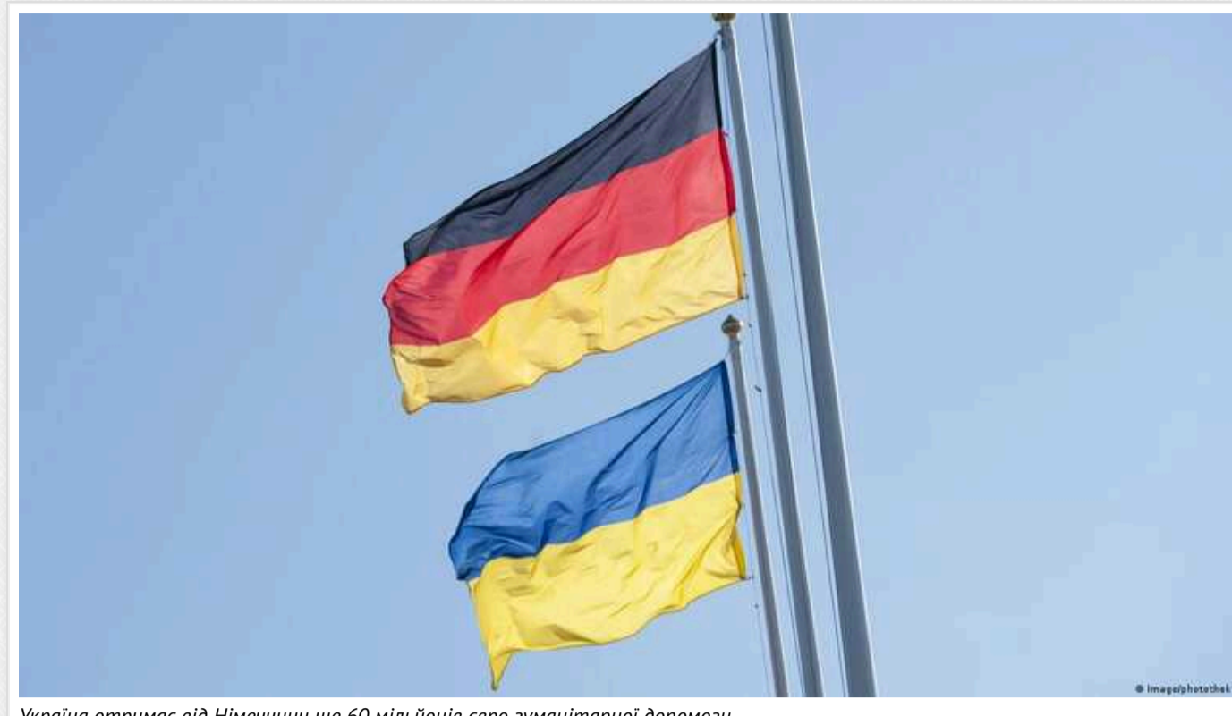
Україна отримає від Німеччини ще 60 мільйонів євро гуманітарної допомоги

Голова МЗС Німеччини Анналена Бербок заявила про плани ФРН виділити ще 60 мільйонів євро на гуманітарну допомогу Україні.