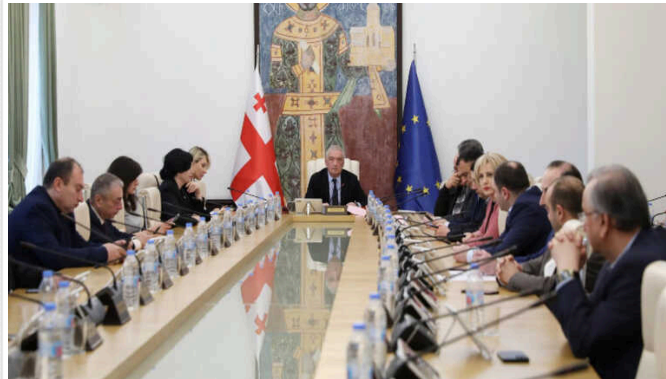
У Грузії комітет парламенту з юридичних питань схвалив подолання вето президента на закон про іноагентів

Депутати можуть подолати президентське вето більшістю голосів, яких достатньо у правлячій партії «Грузинська мрія».