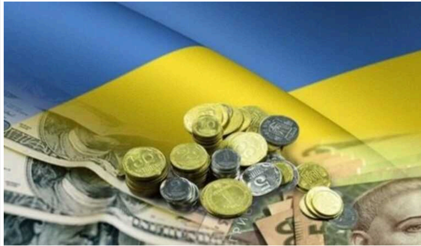
Держборг України перевищив 6 трильйонів гривень - Мінфін

Протягом квітня 2024 року сума державного та гарантованого державою боргу України збільшилась у гривневому еквіваленті на 86,17 млрд грн, у доларовому еквіваленті - на 0,47 млрд дол. США.