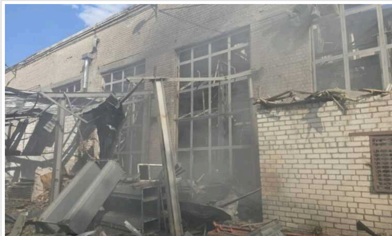
Авіаудар окупантів по Харкову: в ОВА показали фото наслідків

Російські окупанти сьогодні, 27 травня, вдарили по Харкову керованими авіабомбами. "Прильоти" були у Холодногірському районі.