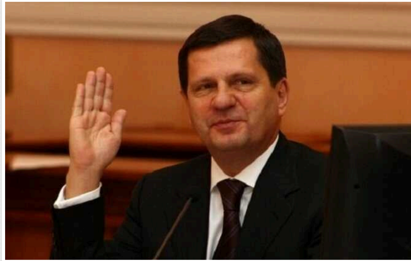
Ексголова Одеси Олексій Костусєв, якого розшукує НАБУ, має готель у Празі

Ексголова Одеси та ексочільник АМКУ Олексій Костусєв на пару зі своїм братом Георгієм Костусєвим-Муромцевим володіють розкішним готелем у центрі Праги за 5,4 млн євро.