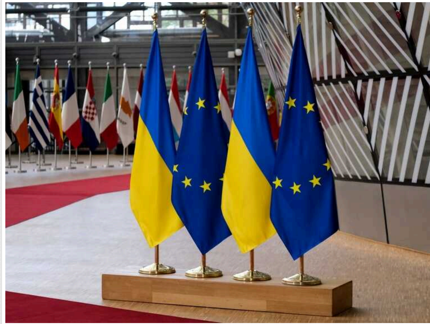
Восени ЄС хоче організувати мирну конференцію щодо України вже за участю Росії, – Bloomberg

Видання Bloomberg, із посиланням на джерела, пише, що ЄС хоче організувати восени мирну конференцію щодо України вже за участю Росії.