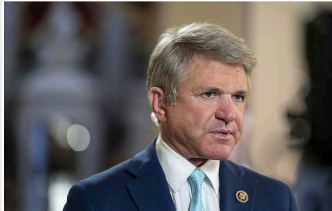
США постачатимуть Тайваню новітню зброю, а не «стару», як Україні, – голова комітету Конгресу

Голова комітету із закордонних справ Палати представників Конгресу США Майкл Маккол заявив, що США поставлять Тайваню новітню зброю, а не "стару", як Україні.