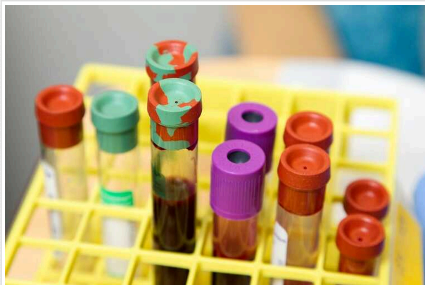
Можливо вчені знайшли спосіб виявляти рак за сім років до діагнозу: вся справа в білках у крові

Фахівці з Оксфордського університету ідентифікували в крові людини 618 білків, які є маркерами 19 видів раку. У ході масштабного двоетапного дослідження, опублікованого в Nature Communications, особливу увагу привернули 107 білків, зміни яких можуть вказувати на розвиток онкології на ранній стадії.