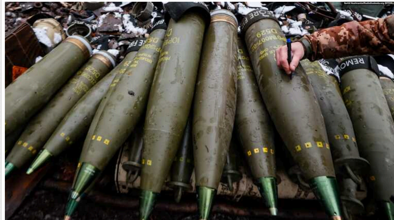
В ISW пояснили позицію Кремля щодо переговорів з Україною та оцінили темпи виробництва снарядів в Росії

Країна-терорист Росія протягом 2024 року планує виготовити втричі більше артилерійських снарядів, ніж Захід. Водночас російські снаряди мають проблеми з контролем якості, а українська артилерія точніша і надійніша в бою.