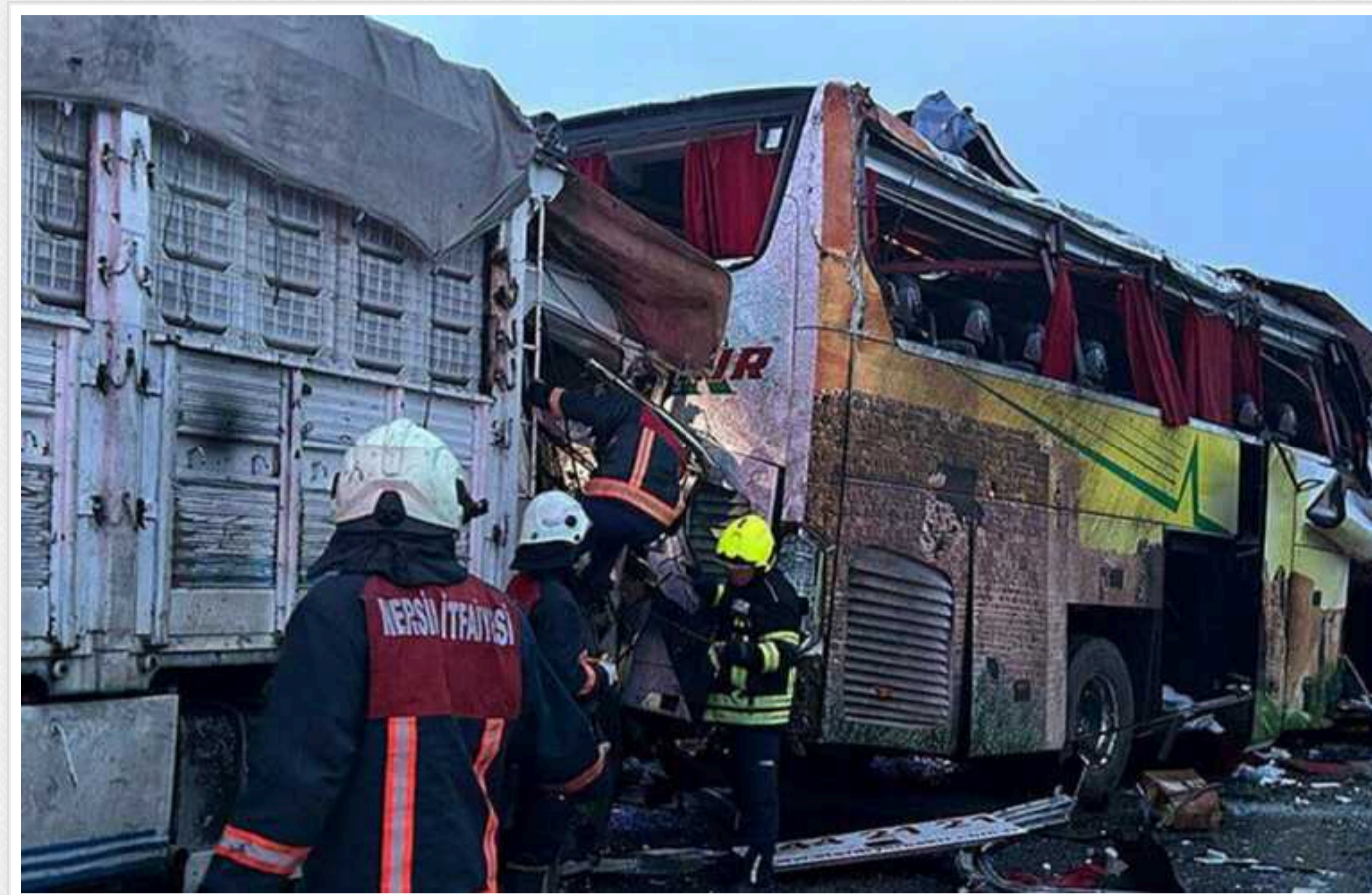
Унаслідок ДТП на південному сході Туреччини загинули щонайменше 11 людей

У ДТП поряд із містом Мерсін на південному сході Туреччини загинули 11 людей, ще 29 постраждали.