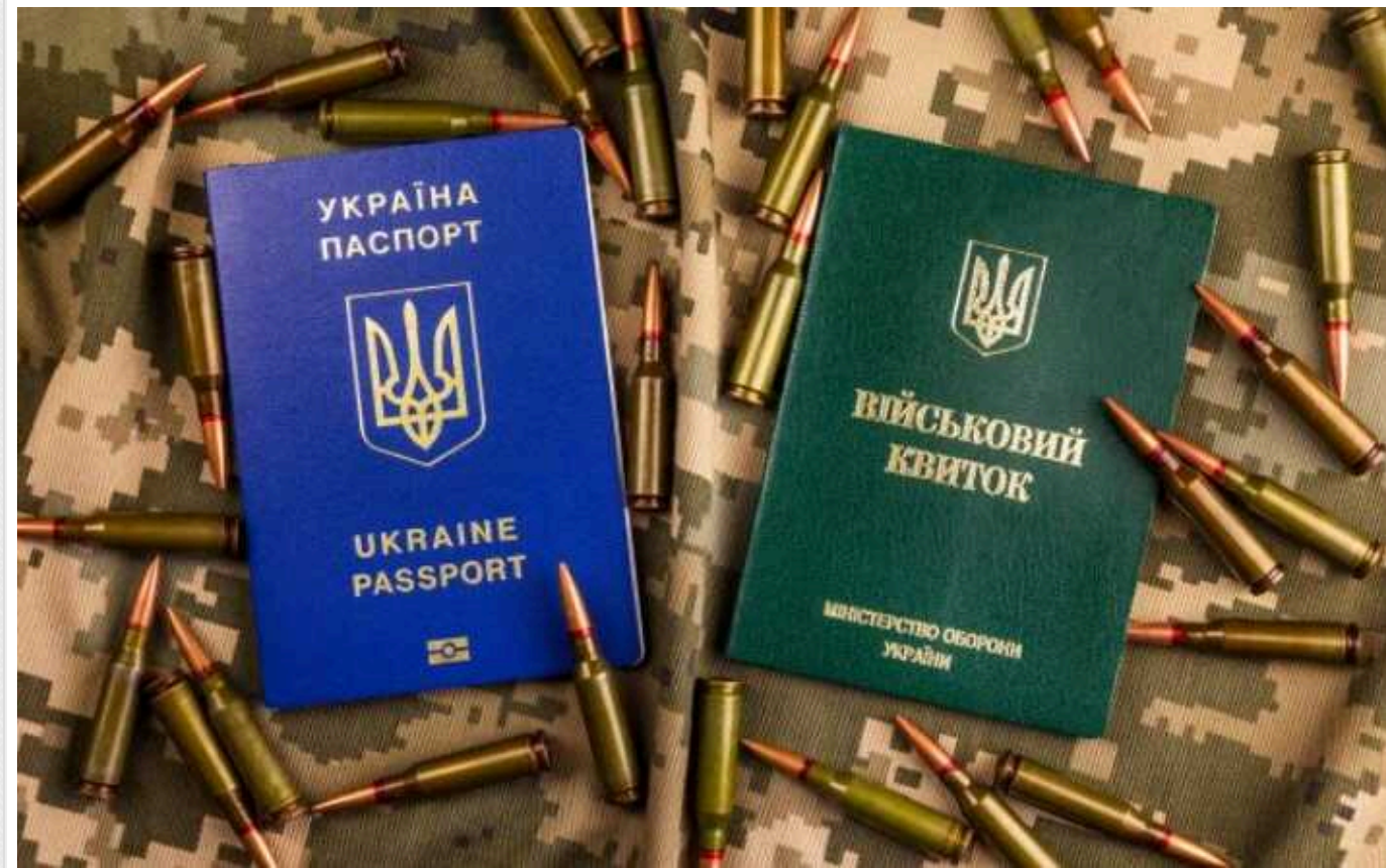
Хто має право перевіряти військово-облікові документи, крім ТЦК

Співробітники територіальних центрів комплектування можуть вимагати від військовозобов'язаних показати військовий квиток. Але таке право мають не лише представники ТЦК.