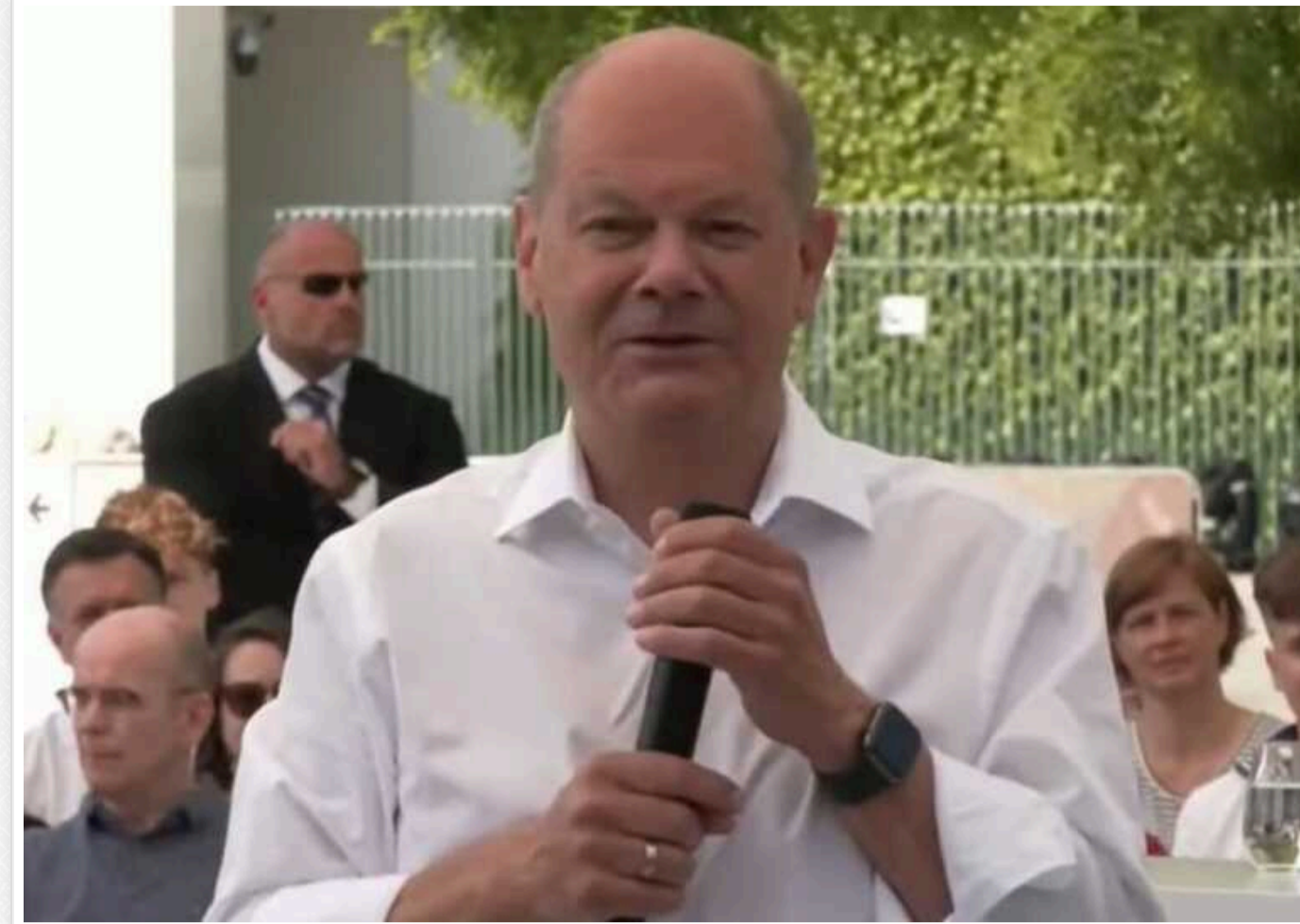
Шольц припустив, що вступ України до Альянсу не очікується "у наступні 30 років"

На мітингу з виборцями у Берліні канцлер нагадав, що він говорив про це, зокрема й у Києві два з половиною роки тому, і "це було зрозуміло всім".