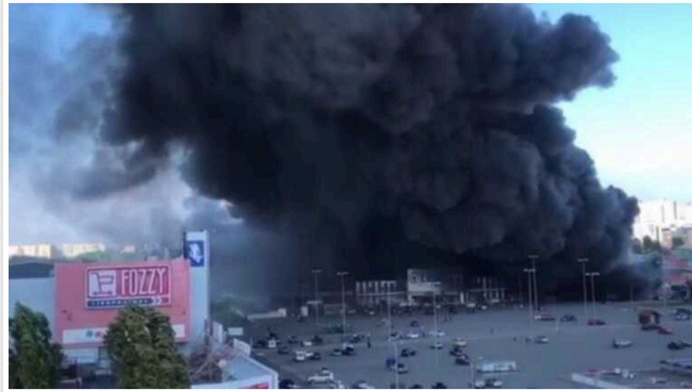
У мережі публікують ще кадри удару окупантів по Епіцентру у Харкові

Про це повідомляє обласна прокуратура та публікує відео з камер спостереження.