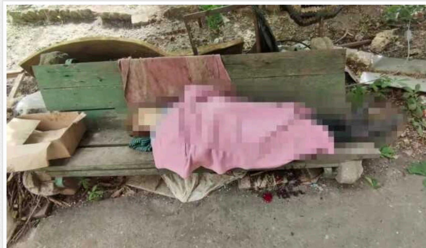
Унаслідок обстрілів Донецчини загинули троє та поранено двох мирних жителів

26 травня 2024 року окупанти обстріляли м. Сіверськ. Внаслідок атаки на подвір'ї будинку загинула 86-річна жінка.