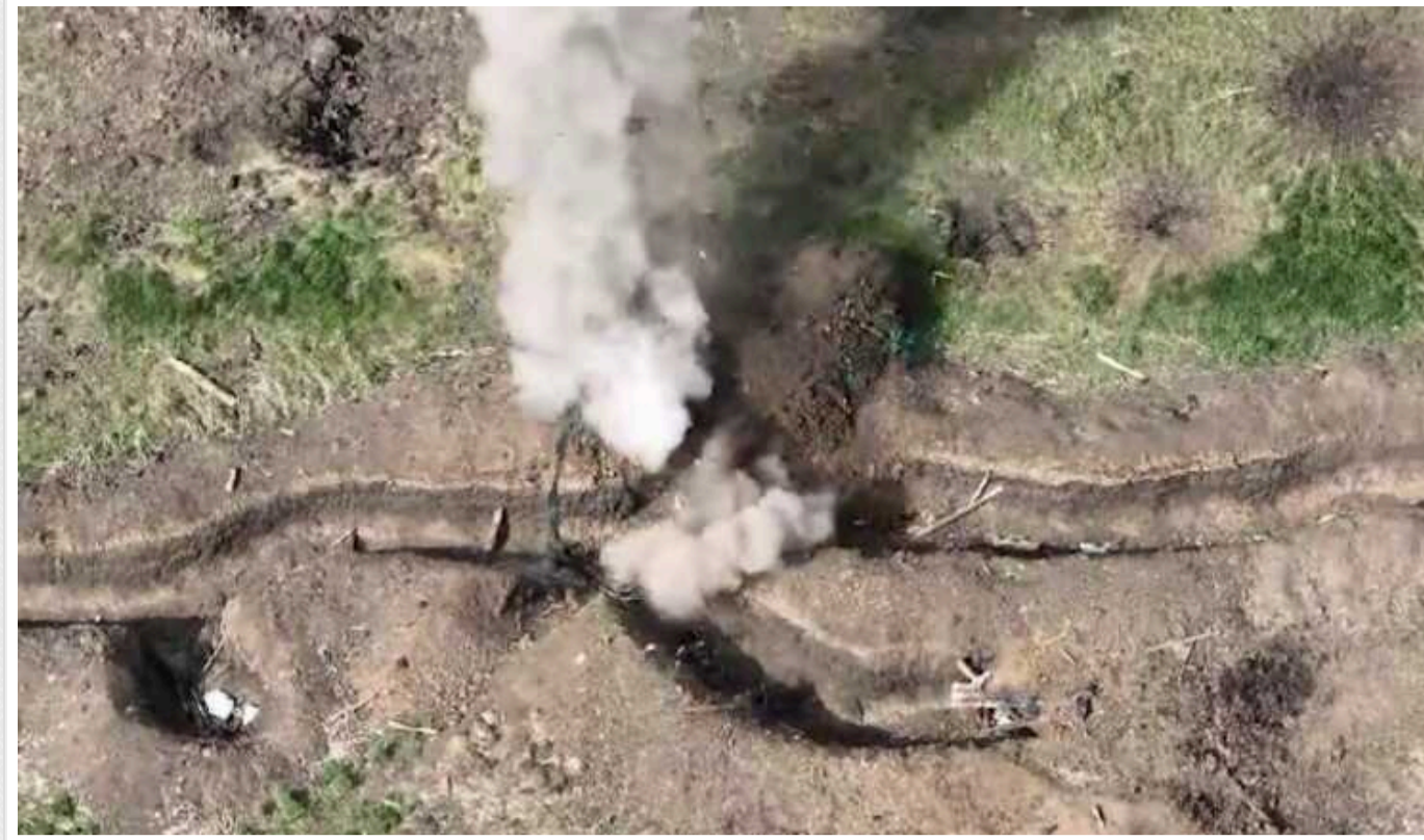
Українські прикордонники на Донеччині знищили БМП та укриття окупантів

На Соледарському напрямку білці-прикордонники виявили та знищили пошкоджену підривом на протинковій міні російську бойову машину піхоти – БМП-2.