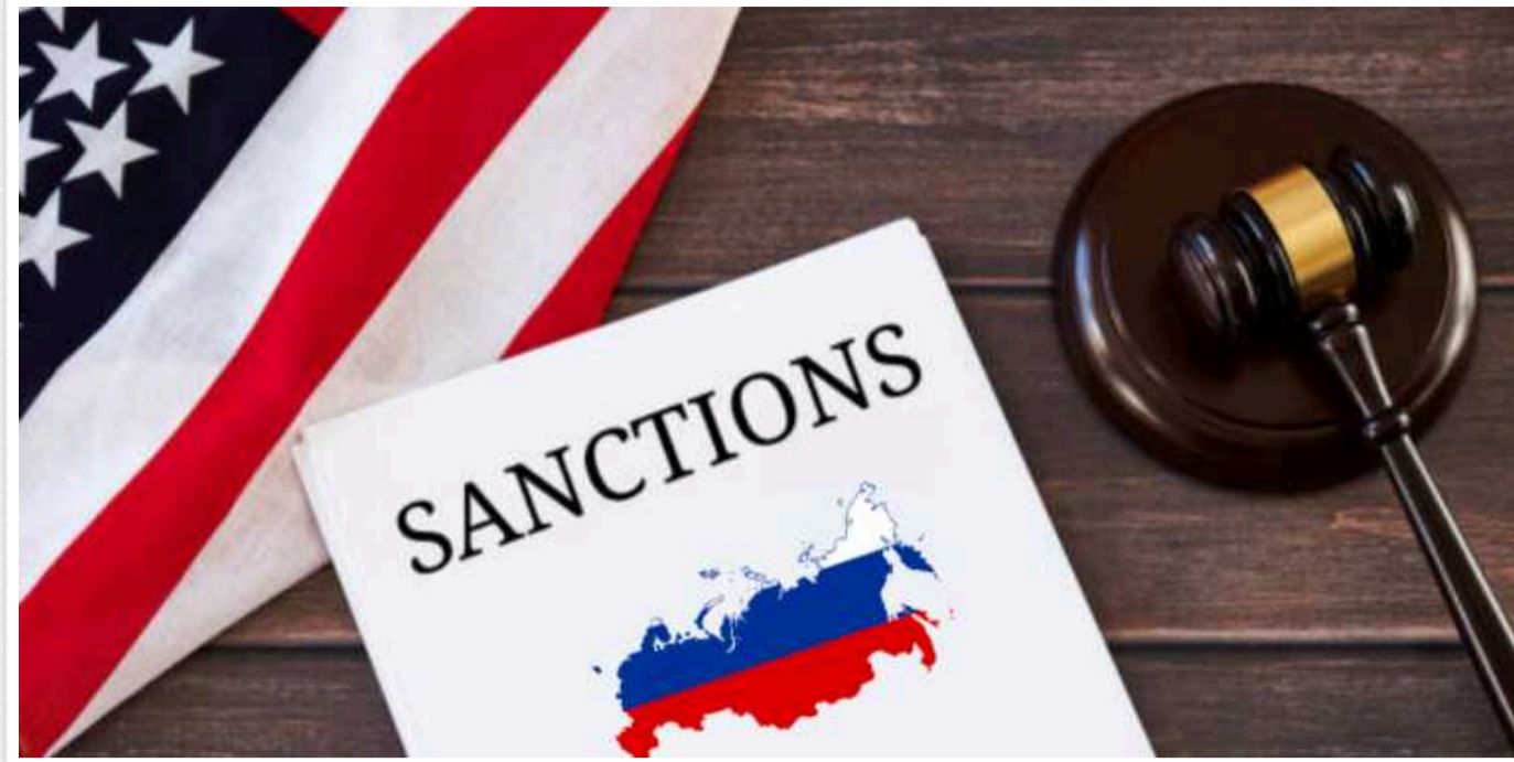
Сполучені Штати планують посилити санкції щодо банків Європи, які досі працюють у Росії

Сполучені Штати розглядають можливість посилення вторинних санкцій для європейських банків, які продовжують вести бізнес у Росії.