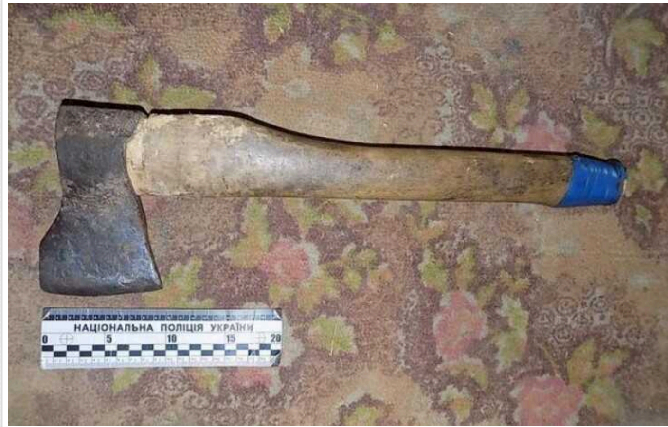
У Полтавській області встановлено обставини вбивства майже 15-річної давності

По базам даних Міністерства внутрішніх справ України мешканець Полтавщини (1979 року народження) значився безвісти зниклим із 2009 року. Обставини його зникнення поліції вдалося встановити вже у травні 2024 року. З'ясувалось, що зниклого мешканця Лубенщини вбили та кинули в колодязь. Поліція встановила підозрюваного в злочині. Триває досудове розслідування.