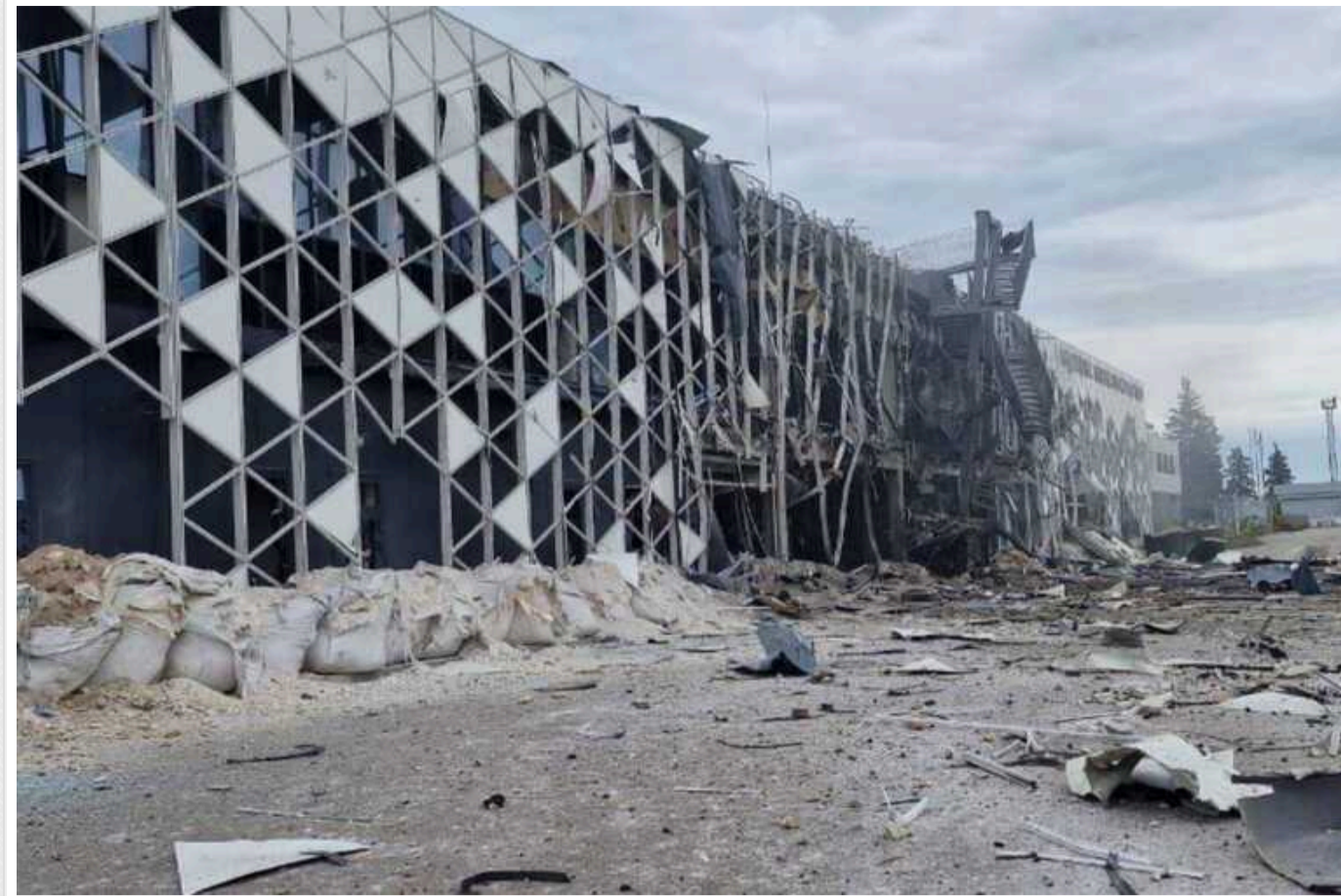
У мережі опублікували фото зруйнованого аеропорту в Запоріжжі