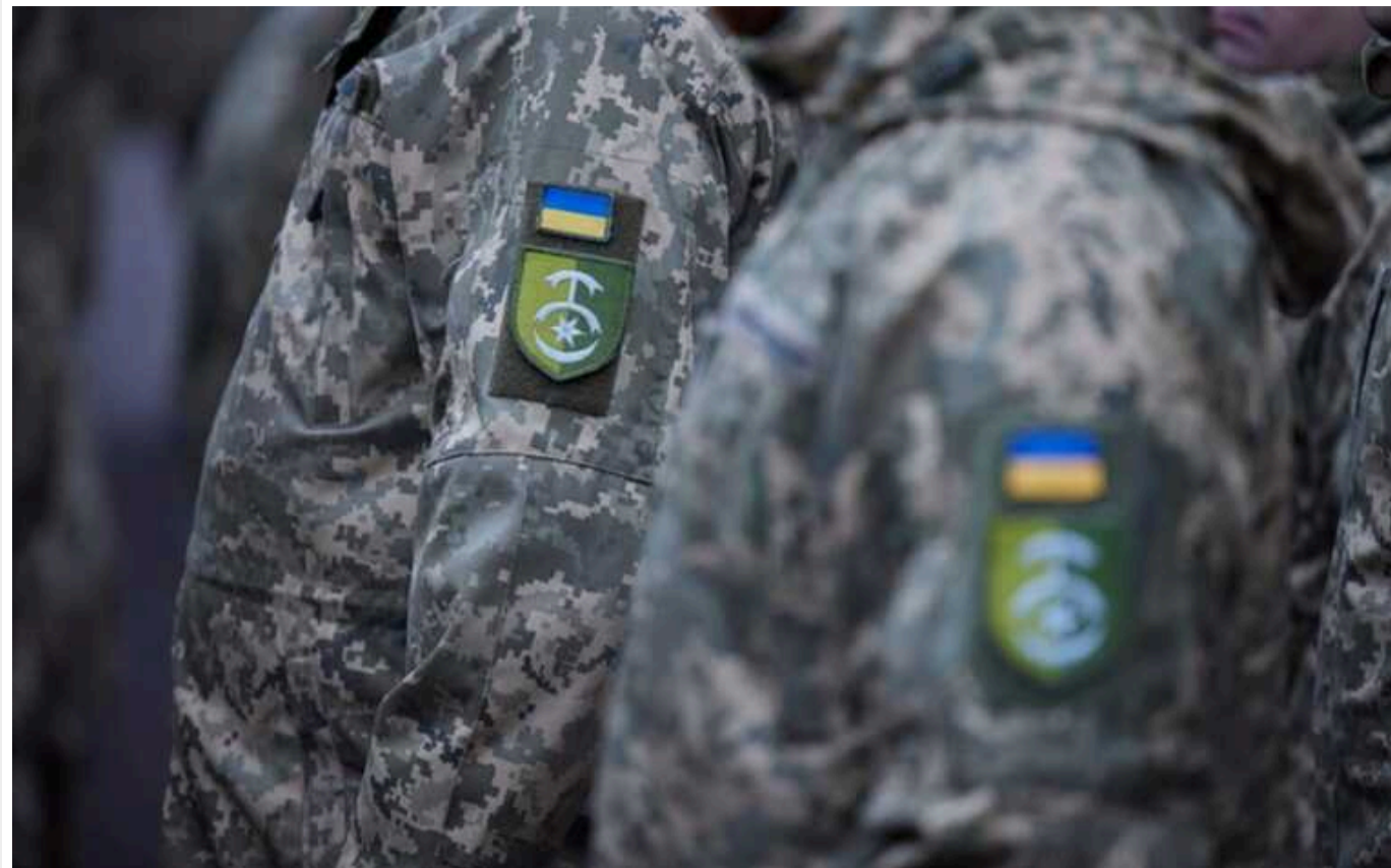
Середній вік українських бійців на фронті становить 43-45 років, - Bloomberg

У матеріалі зазначають, що, попри новий Закон про мобілізацію, який знижує призовний вік, трудові ресурси залишаються проблемою. Високопоставлений військовий чиновник розповів агентству, що середній бойовий вік захисників ЗСУ становить 43-45 років.